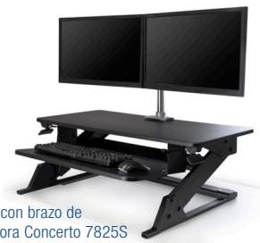
Mostrado con brazo de computadora Concerto 7825S (de venta por separado)